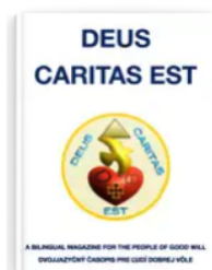
DEUS CARITAS EST 2023