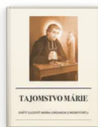
TAJOMSTVO MÁRIE 2023