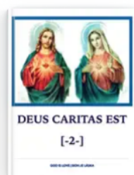
DEUS CARITAS EST [-2-] 2023